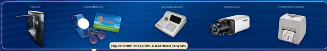
управление доступом к платным услугам